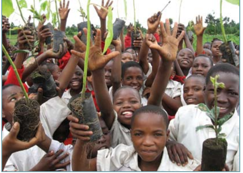
Afrıkadaki çocuklar kendi halklarını güçlendirmeye yardımcı olmak amacıyla ağaç dikteler.

Çoğunlukla, büyük bir kaynak gerektirir çocuklardaki körlüğü engellemek, yiyecek ve giyecek sağlamak barınma, mesleki beceriler, yaşam becerileri kazandırmak, okullar inşa etmek, gençlik kampları, pediatri klinikleri... LCIF Lionlara, çocuklara büyük ölçüde destek olmaları için yardımcı olur. LCIF tek bir Lion kulübünün başa çıkamayacağı projelerde veya büyük problemlerde onların partneri olur. LCIF bizim için sağlam bir kaya gibi arkamızda durmaktadır. LCIF cocuklara iyi bir sağlık, kaliteli bir eğitim ve en yüksek potansiyellerine ulaşip bunu bir gün toplumun yararına geri verecek şansı sağlar.