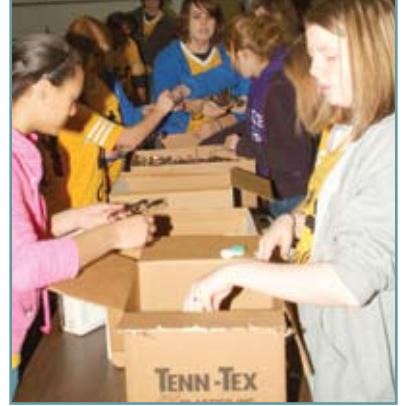
Kuzey Karolina Leo'ları toplanan gözlük çerçevelerini sınıflayarak kutulara dolduruyorlar.

İsveç Leo'ları Polonya ve Litvanya'dan gelen engelli çocukları kurdukları yaz kampında taşıyorlar.