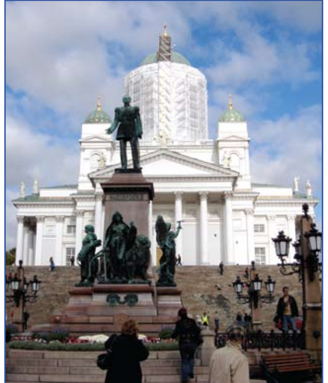
Çar Aleksandr Kilisesi