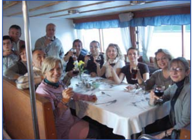
Helsinki'de tekne gezisi

Helsinki'deki iki günlük kısa ziyaretimizi sonlandırarak Avrupa Forumunun yapılacağı Tampere kentine otobüsle geçtik. Tüm Türk Grupları burada buluştu. Toplamda 100 kişiyi geçtiğimizi sanıyorum. Muhtemelen en kalabalık gruplardan birisi bizdik.