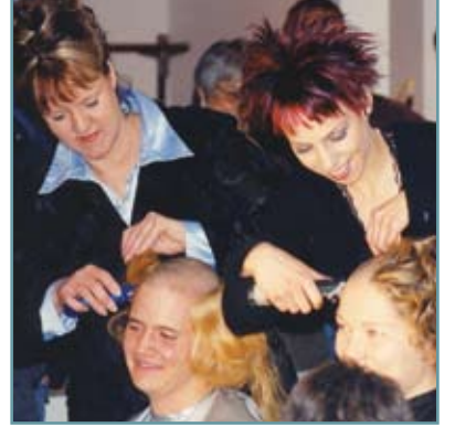
Kanada, Alberta Leo'ları suç oranını düşürmek amacıyla fon geliştirmek için kafalarını kazıtıyorlar.

Leo'lar bitmek bilmeyen enerjileri ile daha yaşanabilir bir dünya için Lions programlarına destek veriyorlar. Bunun yanında kişisel gelişimlerine de katkı sağlıyor, kendilerini yaşama hazırlıyorlar. Bir Leo kulübüne girmek demek, sadece 'hizmet etmek' demek değildir.