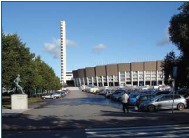
Helsinki Olimpiyat Stadı

Helsinki'de gezecek yer bulmak oldukça zor. Bunlardan birisi de efsanevi atlet Paavo Nurmi'nin (Uçan Finli) 5000, 10000 ve maratonu kazandığı yer olan Helsinki Olimpiyat Stadı. Bence ilginç bir yanı yok ama Finlandiya gibi küçük bir ülkenin 1952 yılında olimpiyat alabildiğini görmek ve bizim halen süründüğümüzü bilmek beni üzdü açıkçası.